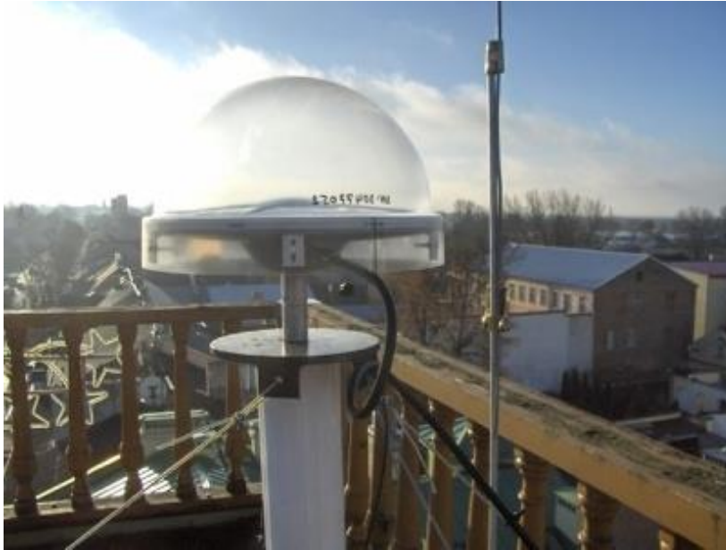
Fot. 1 Stacja referencyjna GPS (zdjęcie poglądowe).