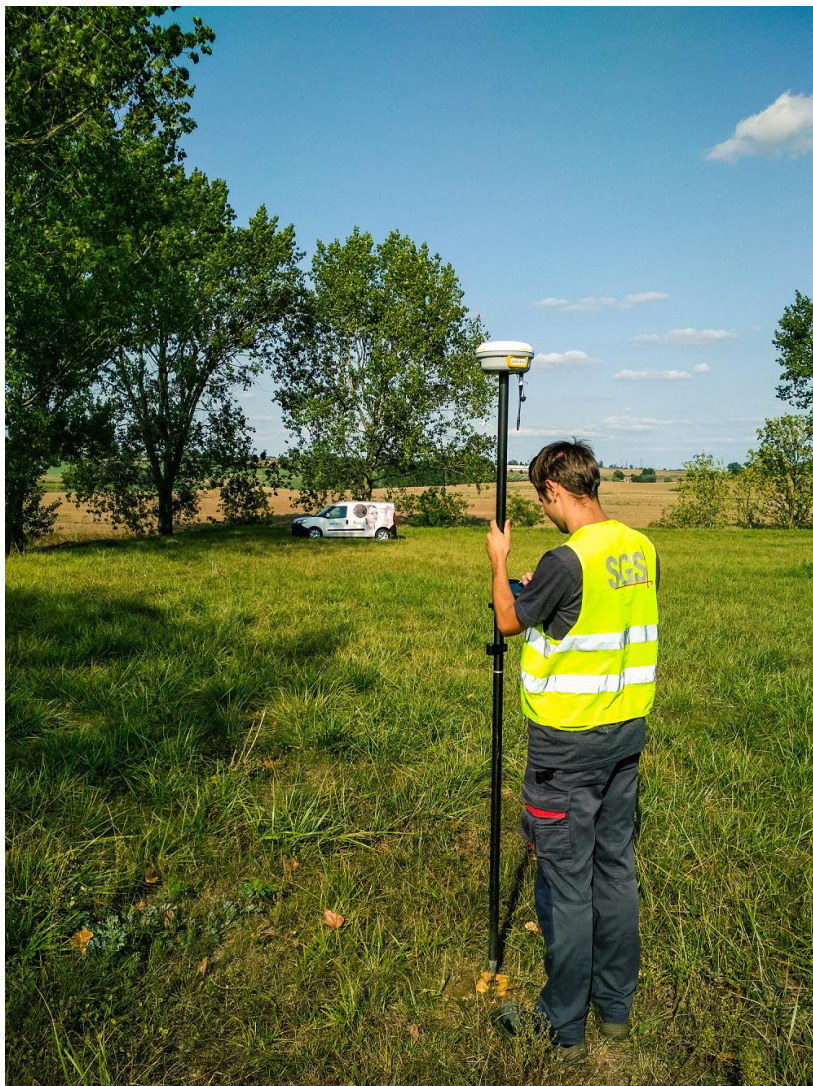
Fot. 2 Pomiar metodą statyczną (zdjęcie poglądowe).