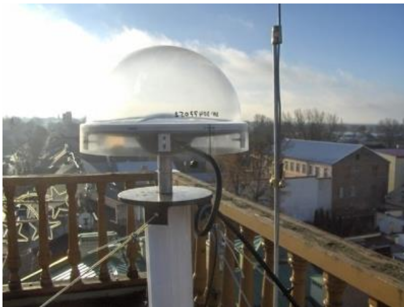
Fot. 1 Stacja referencyjna GPS (zdjęcie poglądowe).