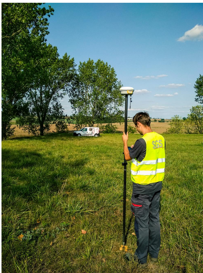
Fot. 2 Pomiar metodą statyczną (zdjęcie poglądowe).